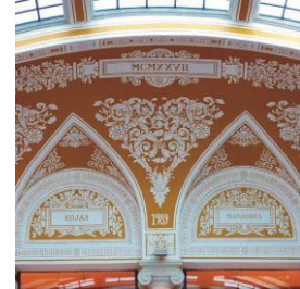
Fotografies finalistes del concurs Opengram exposades a la Sala Ciutat